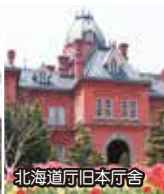
北海道庁旧本庁舎