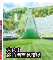
大倉山跳台滑雪競技場